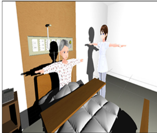
図1 製作中の病室空間とCGキャラクターの一例